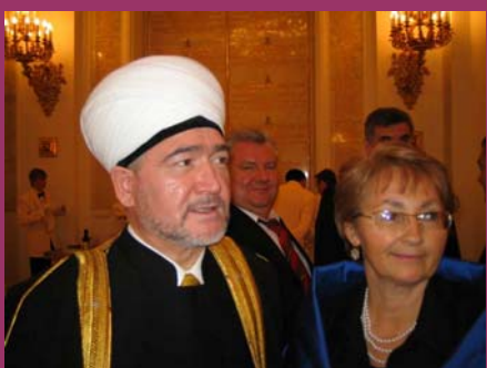
Москва, кремль 4 ноября 2005

В нашей стране родился новый праздник: 4 ноября объявлено Президентом России Днем национального единства и добрых дел. Это означает, что благотворительность не просто стала модным словом, но частью государственной политики. Солнечным ноябрьским днем на торжественный обед в Кремле были приглашены 300 граждан России, вершащих добро. Страна была представлена реальными людьми, за которыми стоят проблемы, беды и те, кто ждет помощи. В своем обращении к нам, сидящим за праздничными столами в Георгиевском зале, В.В.Путин заявил: «С сегодняшнего дня, в 2006 году и в последующие годы развитие получит широкое партнерство – заинтересованный диалог государства и благотворительных институтов». В непринужденной обстановке можно было пообщаться не только с главными для нас министрами, М.Ю.Зурабовым и А.А.Фурсенко, но и с самим Президентом.