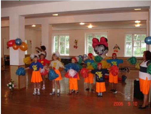
Детский праздник в Екатерининском доме-интернате