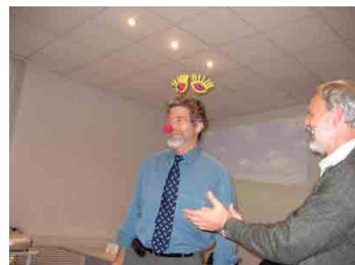
Карел де Рой в роли «доброго доктора»