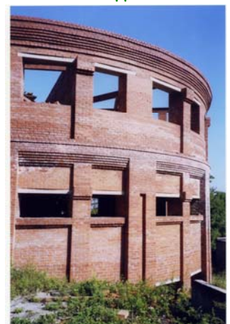
Закончен третий этаж «родительского дома»

...Екатериновка - большая часть моей жизни. Среди этих маленьких борцов я черпаю свои силы и ращу крылья, в их незатейливых рассказах зреет моя мудрость, их печалью и радостями я буду жить до следующей волнующей встречи.