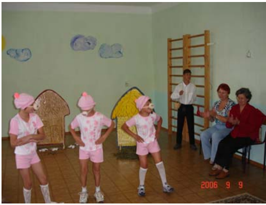
Сказка «Три поросенка» в исполнении детей из Екатерининского дома-интерната