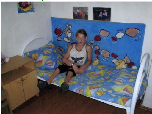
Кровати, приобретенные при поддержке Фонда «Дети России»