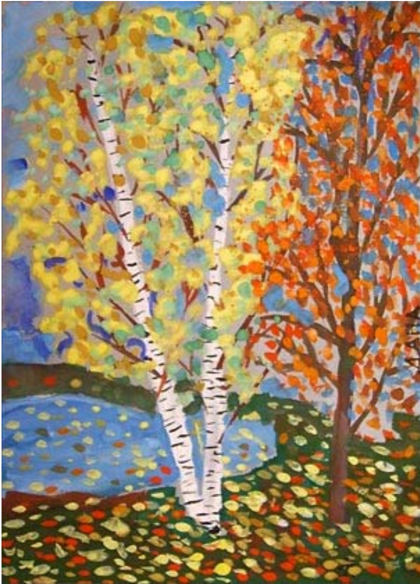
Рис. Марасиновой Даны