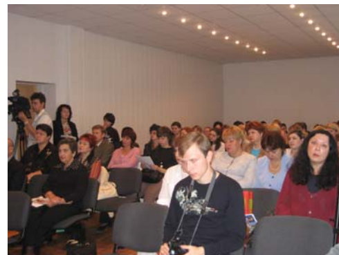
Участники семинара на одном из заседаний