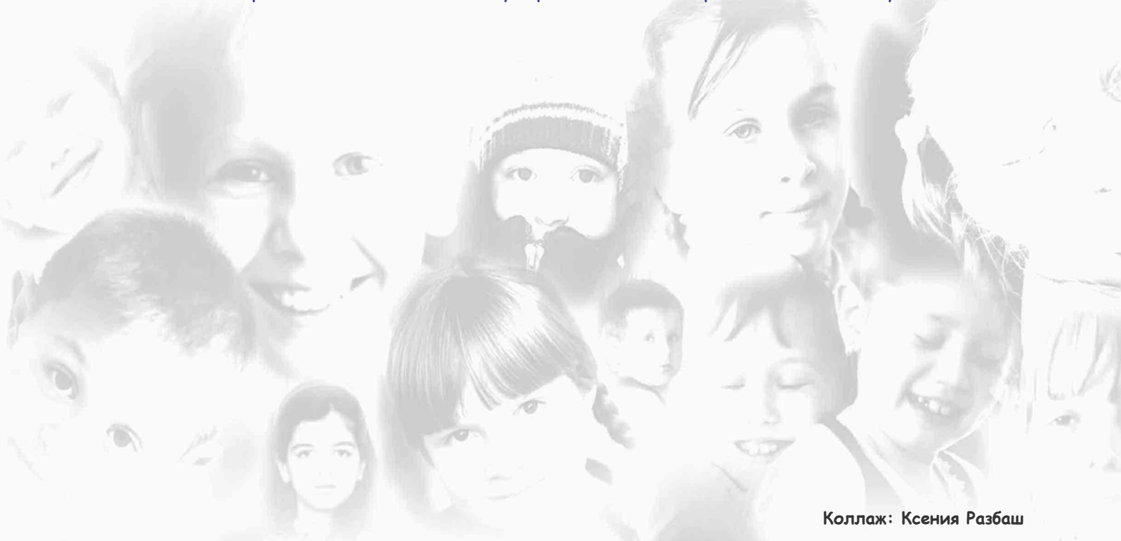
Коллаж: Ксения Разбаш

Деятельность Фонда является не только замечательной моделью объединения усилий общественной организации, государственных структур и бизнес сообщества для решения социально значимых проблем в стране, но и механизмом, помогающим появлению гражданского общества в России. Эта модель отвечает политике Правительства Российской Федерации, направленной, по словам Президента В.В. Путина , на создание «широкого партнерства как заинтересованного диалога государства и благотворительных институтов».